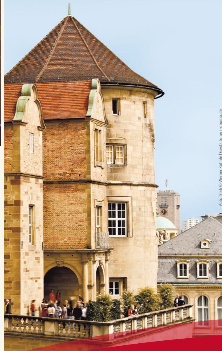
Abb. Titel: Gestaltung: i-dbüro.de

»In guter Gesellschaft Kunst und Kultur erleben ...«