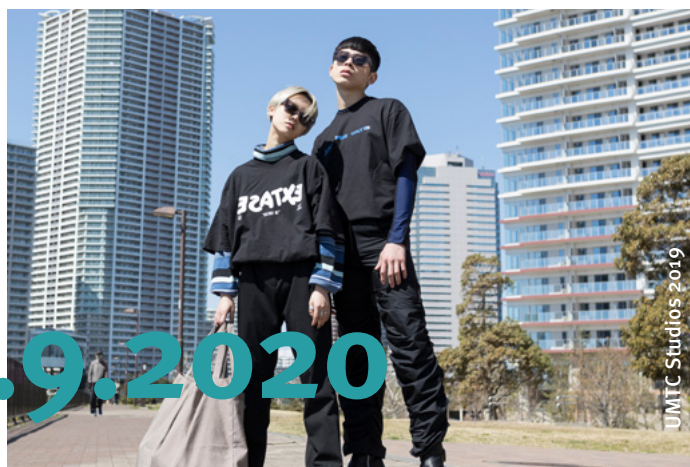
UMTC Studios 2019

Parallel zeigt das Kindermuseum Junges Schloss vom 24.10.2020 – 1.8.2021 die Mode-Mitmachausstellung Ran an den Stoff! für Kinder und Familien.