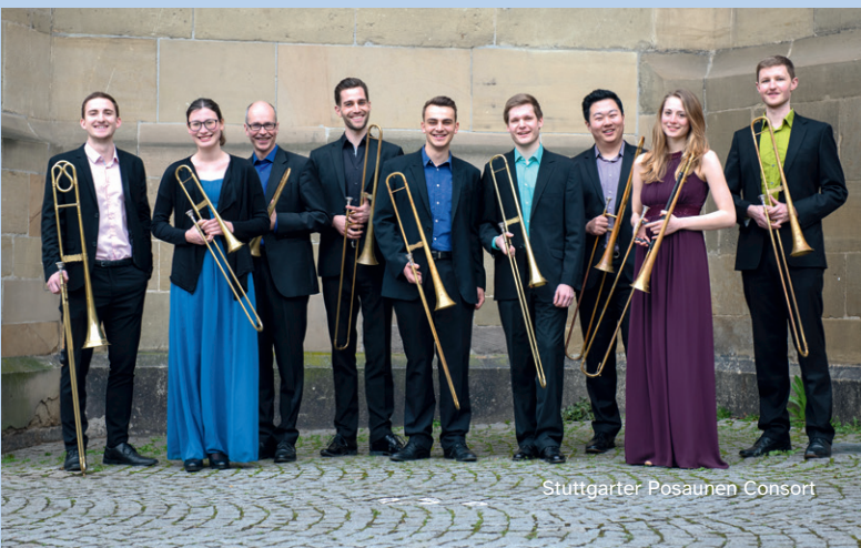
Stuttgarter Posaunen Consort